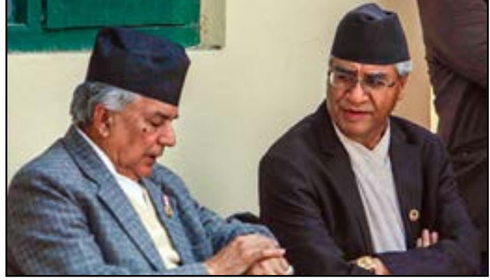
यद्यपि हामी सानो संख्यामा छौं, तैपनि ठूलो छ,' पौडेलले भनेका थिए ।

दलको सही भूमिका निर्वाह गर्नुपर्छ । हाम्रो भूमिका ठूलो छ, हाम्रो जिम्मेवारी