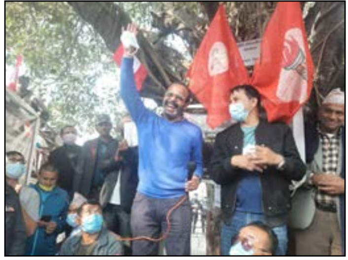
नदिनेमा आफूहरू विश्वस्त रहेको नेता रिजालको निष्कर्ष थियो । यसैगरी भापा क्षेत्र नं-१ को

नगरिए संविधानको हत्या भएको ठहर हुने भन्दै सम्मानित सचीव अदालतले पनि त्यो अवस्था आउन