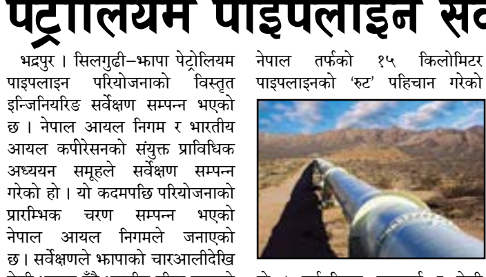
– सन्दर्भ समाचारदाता

भद्रपुर । सिलगुठी-भापा पेट्रोलियम पाइपलाइन परियोजनाको विस्तृत इन्जिनियरिङ सर्वेक्षण सम्पन्न भएको छ । नेपाल आयल निगम र भारतीय आयल कर्पोरेसनको संयुक्त प्राविधिक अध्ययन समूहले सर्वेक्षण सम्पन्न गरेको हो । यो कदमपछि परियोजनाको प्रारम्भिक चरण सम्पन्न भएको छ । सर्वेक्षणले भापाको चारआलीदेखि मेची भन्सार हुँदै भारतीय सीमा सम्मको