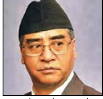
काठमाडौं । नेपाली कांग्रेसका

सभापति शेरबहादुर देउवाले, बिरोध प्रदर्शन एवम् निर्वाचनमा कांग्रेस एकलै हिड्ने बताएका छन् । नेपाली कांग्रेस भक्तपुर क्षेत्र नम्बर २ ले आयोजना गरेको विरोधसभालाई सम्बोधन गर्दै सभापति देउवाले यस्तो बताएका हुन् । ‘नेपाली कांग्रेस कसैसँग मिलेर निर्वाचनमा जाँदैनेँ मिलेर गएको फल पाइसक्यौँ एकलै जान्छौँ,’ उनले भने, ‘एकलै जाँदा हाम्रो शक्तिको आँकलन हुन्छ । जनतालाई आफ्नो धारणा