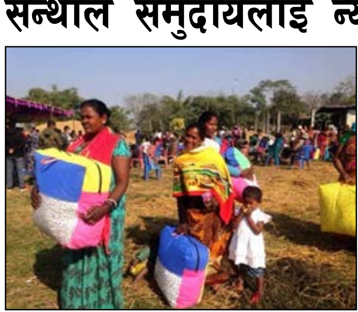
– सन्दर्भ समाचारदाता

भद्रपुर । भापा गाउँपालिका-१ मिलनवस्तीका २२ घर परिवार सन्थाल समुदायले जाडोका लागि न्यायो सिर्क पाएका छन् । लान्स्य क्वल अफ सुरुङ्गाले सहारा नेपालको सहयोग गमा ल्याइएको सिर्क समुदाय प्रहरी साभेदारी कार्यक्रम अन्तर्गत जिल्ला प्रहरी कार्यालय र जिल्ला प्रशासन कार्यालयको सहकार्यमा शुक्रवार नयाँ प्रधानमन्त्रीका रूपमा उहाँ चित्रीत हुनु भएको छ । नेपालको राजनीतिक इतिहासमा नै उहाँ कलक लागेको एउटा प्रधानमन्त्री बनिसक्नु भएको छ । अबै समय छ उहाँले चालेको कदम सुधारर इतिहासमै कलौकत नहुनुस भन्ने मेरो सुभेक्षा हो ।