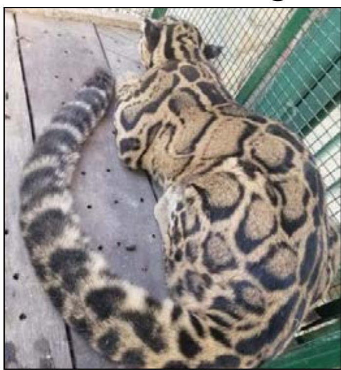
त्यहाँ घाइते चितुवाको उपचार समेत भइरहेको जनाइएको छ ।