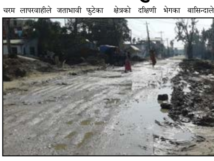
चरम लापरवाहीले जताभावी फुटेका क्षेत्रको दक्षिणी भेगका बासिन्दाले भइरहेको पाइएको छ ।

—सन्दर्भ समाचारदाता भद्रपुर । निर्माण ठेकेदारको ढिलासुस्ती तथा खानेपानी संस्थानको चरम लापरवाहीले भद्रपुर स्थित भानु चौक उत्तर संगम दक्षिणको मेची राजमार्ग यात्रुको ज्यान लिने दुर्घटना स्थल बन्दै गएको छ । हुलाकी सडक अर्न्तगत लिङ्ग रोडका रूपमा चार वर्ष अगाडिबाट निर्माण थालनी भएको सो सडक खण्ड जताभावी खनेर छोड्दा फुटेका पाइप लाइन खानेपानी संस्थान भद्रपुरले समयमै मर्मतसंहार नगर्दा हिलाम्मे सडकका खालडाखुल्डीले यात्रुको ज्यान लिने दुर्घटना स्थल बन्दै गएको हो ।