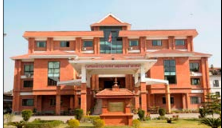
यतिबेला नेपाली राजनीतिमा चर्का उथलपुथल आएको देखिन्छ। 'त्यो उथलपुथल ल्याउने काम गरिरहेको छ एउटा फायलले' भन्छन् अनुसन्धानमा

पोख्त एक पूर्व सरकारी अधिकारी। सत्ताखट दल नेकपाभित्र अहिले चलिरहेको चर्का विवादको मुख्य कारण पनि त्यही फायल नै हो भन्ने ठोकुवा गर्छन् ती पूर्व अधिकारी। संवैधानिक परिषदको विषयमा अहिले भइरहेको विवाद र अघ्यादेश प्रकरणको मुख्य कारण यसैलाई मानिएको छ। अख्तियार दुरुपयोग अनुसन्धान आयोगमा थन्किएर रहेको भनिएको त्यो फायलले नेपाली राजनीतिलाई निरन्तर प्रभावित गरिरहेको छ। तर, मुख्य नेताहरू कोही पनि त्यो फायलका बारेमा एक शब्द बोल्दैनन् वा बोलुनुलाई जोखिम मान्छन्। माओवादी लडाकूलाई विभिन्न शिबिरमा राखेको अवधिमा उनीहरूको भरणपोषण