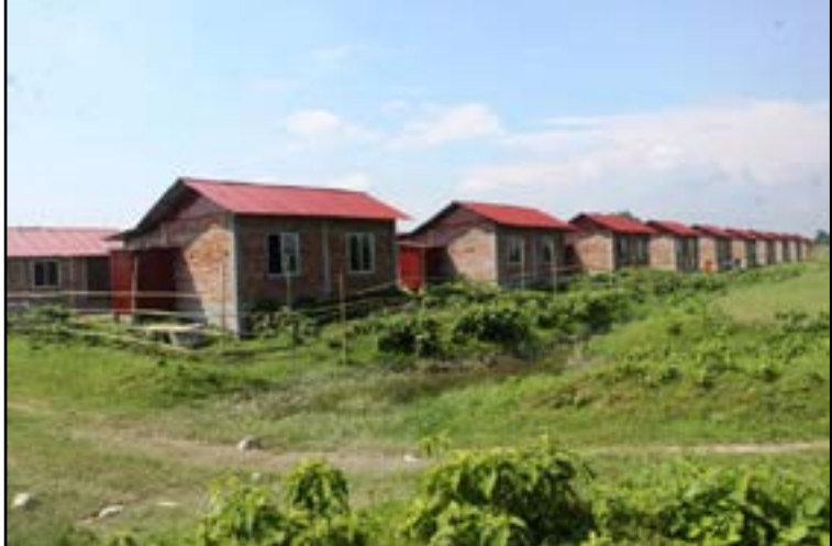
भापाको भापा गाउँपालिका वडा नं. २ कुमरखोदस्थित सन्थाल जातिको लागि निर्माण गरिएका घरहरू।